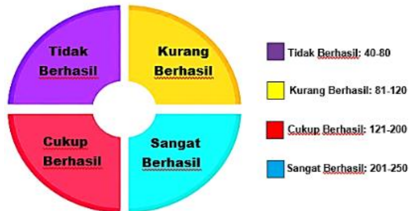
Gambar 4.1 Hasil Tahap Moneva Partisipan

Kesimpulan hasil monitoring dan evaluasi partisipatif setelah dijumlahkan nilai keseluruhannya adalah sebesar 151. Rentang nilai 151 masuk dalam kuadran III yaitu cukup berhasil dengan rentang nilai 121-200. Penilaian dalam kegiatan moneva partisipatif bersama masyarakat melalui tabel penilaian atau indikator keberhasilan diharapkan menjadi sebuah evaluasi yang bertujuan untuk perbaikan program yang lebih baik kedepannya.