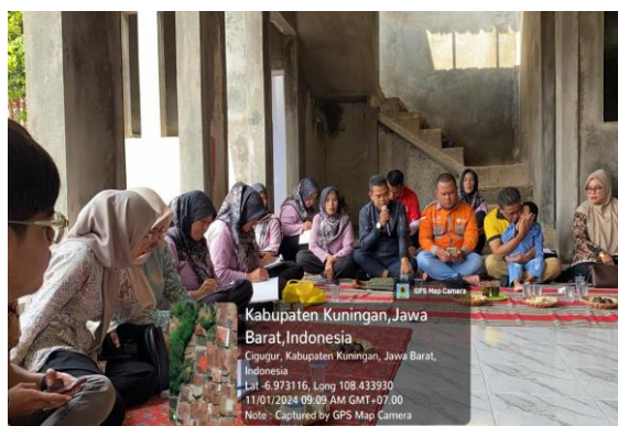
Foto 5.1 Keterlibatan Dalam RAKOR Posyandu