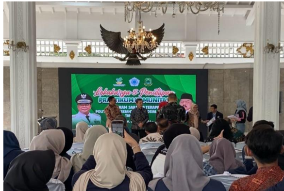
Foto 4.14 Pelaksanaan Penutupan dan Lokakarya Kabupaten Kuningan