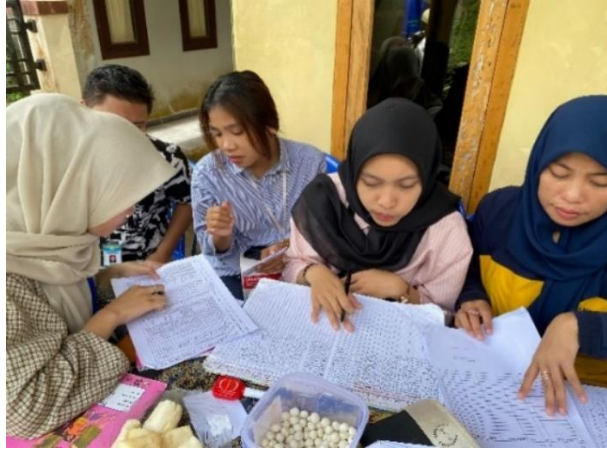
Foto 5.3 Keterlibatan Dalam Kegiatan Posyandu Rutin

Praktikan mengikuti dan ikut terliabt dalam membantu rangkaian kegiatan posyandu yang dilaksanakan secara bergantian perdusun oleh Ibu-Ibu kader PKK dan juga pihak Bidan Desa. Kegiatan Posyandu sangat penting dan bermanfaat bagi masyarakat di Desa Puncak untuk mengetahui perkembangan kesehatan Ibu dan Anak, memberikan akses layanan kesehatan yang mudah bagi masyarakat di Desa Puncak untuk mendapatkan pelayanan kesehatan dasar tanpa perlu pergi jauh. mahasiswa terlibat membantu dalam pengukuran dan pemantauan seperti berat badan, lingkar kepala dan juga lingkar perut terhadap ibu hamil. Praktikan juga mendampingi dan tenaga kesehatan dari desa dalam pemeriksaan, melalui keterlibatan praktikan pada kegiatan posyandu rutin sangat penting dan bermanfaat bagi mahasiswa itu sendiri.