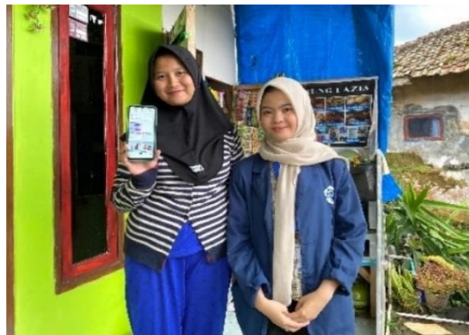
Foto 4.12 Dokumentasi Hasil Tahap Evaluasi

Kesimpulan hasil monitoring dan evaluasi partisipatif setelah dijumlahkan nilai keseluruhannya adalah sebesar 151. Rentang nilai 151 masuk dalam kuadran III yaitu cukup berhasil dengan rentang nilai 121-200. Penilaian dalam kegiatan moneva partisipatif bersama masyarakat melalui tabel penilaian atau indikator keberhasilan diharapkan menjadi sebuah evaluasi yang bertujuan untuk perbaikan program yang lebih baik kedepannya.