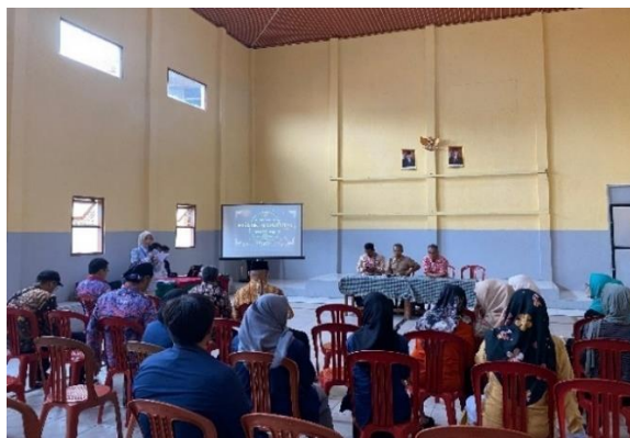
Foto 4.13 Pelaksanaan Lokakarya dan Pengakhiran Desa

Kegiatan ini dilaksanakan pada hari Kamis, 05 Desember 2024 pukul 09.00 sampai dengan 11.00 WIB yang bertempat di Gedung Balai Desa Puncak. Proses lokakarya desa dihadiri oleh Badan Permusyawaratan Desa, Sekretaris Desa Puncak, perangkat desa, Pendamping lapangan, Anggota PKK, Ketua PKK, Ketua MUI, Karang Taruna, Ketua RW/RT, dan warga masyarakat. Dalam kegiatan tersebut praktikan memaparkan hasil praktikum yang disusun dalam bahan tayang berupa power point secara singkat dan diakhiri dengan penyerahan plakat dan hasil laporan praktikum komunitas kepada Sekretaris Desa Puncak dan kepada Ketua Badan Perwusyawaratan Desa serta diakhiri dengan sesi foto bersama.