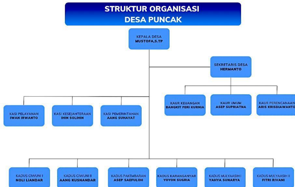
Gambar 3 2 Struktur Organisasi Desa Puncak

pemerintahan serta perangkat desa seperti kepala dusun yang ada di Desa Puncak. Struktur kepemimpinan Desa Puncak dapat dilihat berikut ini: