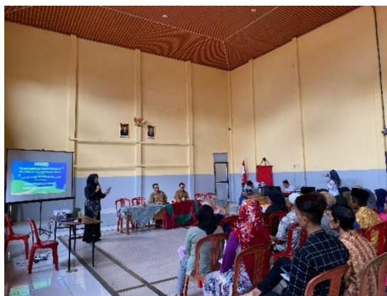
Foto 4.15 Pelaksanaan Kegiatan Perekaman & Perbaikan KTP

Praktikan melaksanakan program perekaman perekaman KTP pada tanggal 03 Desember 2024, di Gedung Balai Desa. Program layanan ini dilakukan dengan bekerjasama dengan Dinas Kependudukan dan Pencatatan Sipil. Kegiatan ini bertujuan untuk membantu masyarakat dalam mengatasi masalah administrasi kependudukan yang menjadi salah satu kebutuhan dasar. Beberapa program yang telah dilaksanakan meliputi perekaman dan perbaikan KTP, pembuatan Kartu Identitas Anak (KIA), serta perbaikan Kartu Keluarga dan Akta Kelahiran. Dalam kegiatan ini Dinas Kependudukan dan Pencatatan Sipil langsung hadir dan memfasilitasi acara dengan membawa peralatan mulai dari perekaman sampai percetakan. Kegiatan yang diawali dengan sambutan dari kepala desa dan kemudian dilanjutkan dengan kegiatan perekaman, perbaikan dan percetakan.