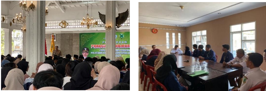
Foto 4.1 Penyerahan dan Penerimaan Praktikan

Kegiatan praktikum komunitas diawali dengan kegiatan penyerahan dan penerimaan praktikan dari Direktur Politeknik Kesejahteraan Sosial Bandung dengan Pemerintah Kabupaten Kuningan di tempat Pendopo Kabupaten Kuningan pada hari Senin, tanggal 28 Oktober 2024 yang dihadiri oleh beberapa Kepala Kecamatan dan Kepala Desa Puncak serta beberapa dosen Poltekesos. Kemudian persiapan sosial ( social preparation ) dilanjutkan pada hari Rabu tanggal 30 Oktober 2024 dengan kembali melakukan pertemuan ditempat Balai Desa Puncak dengan Kepala Desa, Perangkat desa, pendamping praktikan dilapangan dan juga dihadiri oleh beberapa kepala dusun yang ada di dusun puncak. Dalam tahapan ini praktikan menyampaikan maksud dan tujuan serta menjelaskan tahapan dan kegiatan praktikum komunitas serta mensosialisasikan mengenai PPKS dan PSKS