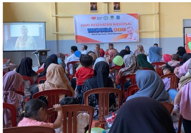
Foto 5.2 Keterlibatan Dalam Kegiatan Wisuda ASI

Kegiatan Wisuda ASI (Air Susu Ibu) merupakan acara yang diadakan untuk merayakan atau mengapresiasi Ibu-Ibu di Desa Puncak dalam memberikan ASI eksklusif kepada bayi mereka selama periode tertentu, yaitu 6 bulan. Kegiatan wisuda ASI diadakan oleh pihak Rumah Zakat, Rumah Zakat itu sendiri adalah sebuah lembaga non-profit yang fokus pada pengelolaan dan penyaluran zakat, infaq, sedekah dan wakaf yang bertujuan dan disalurkan untuk membantu mengatasi mengatasi masalah kemiskinan serta meningkatkan kualitas hidup melalui program sosial dan pemberdayaan. Pada kegiatan wisuda ASI, rumah zakat memberikan penyuluhan tentang pentingnya ASI eksklusif dan penghargaan terhadap ibu-ibu yang memberikan ASI eksklusif selama 6 bulan dan mendapatkan sertifikat atau piagam penghargaan serta cinderamata sebagai