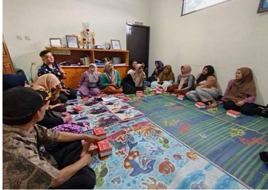
Foto 4.10 Pelaksanaan Kegiatan Intervensi Pelatihan UMKM

Pelatihan pembuatan marketplace dan desain dilaksanakan pada tanggal 28 November 2024 di rumah ketua PKK di Desa Puncak pada pukul 13.00 s.d. 16.00 WIB. Praktikan dan TKM mengundang target group yaitu para pelaku UMKM di Desa Puncak yang di dampini oleh kasi pelayanan sekaligus pendamping lapangan praktikan dan perangkat desa yang berjumlah 2 orang. Pelaksanaan pelatihan penggunaan marketplace dan desain produk melalui aplikasi editing yang bertujuan untuk memberikan keterampilan kepada pelaku UMKM dan menambahkan wawasan serta penguatan dari kegiatan penyuluhan yang telah dilakukan, sehingga dengan melalui pelatihan ini para pelaku UMKM dapat mencoba sedikit demi sedikit mengerti akan hal yang baru bagi mereka.