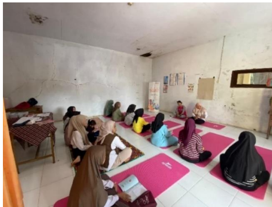
Foto 5.4 Keterlibatan Dalam Kegiatan Senam Ibu Hamil