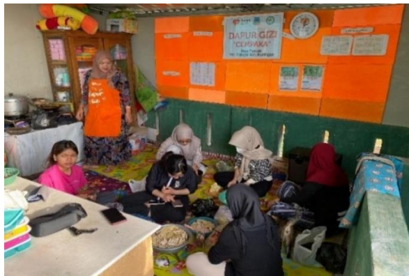
Foto 5.5 Keterlibatan Dalam Produksi Dapur Gizi

Kegiatan produksi dapur gizi bertujuan untuk menyediakan makanan sehat bagi ibu hamil, balita, dan anak-anak dengan status gizi kurang. Kegiatan ini diinisiasi oleh kader Posyandu dengan dukungan dari Rumah Zakat dan pemerintah desa. Praktikan turut berpartisipasi dalam proses ini, mulai dari membantu proses memasak, hingga mendistribusikan makanan kepada penerima manfaat. Selain itu, praktikan juga membantu memberikan edukasi kepada masyarakat tentang pentingnya konsumsi makanan bergizi untuk mencegah stunting dan masalah gizi lainnya. Kegiatan dapur gizi ini juga menjadi media pemberdayaan ibu-ibu rumah tangga untuk memanfaatkan potensi lokal dalam menciptakan makanan sehat dan bernutrisi.