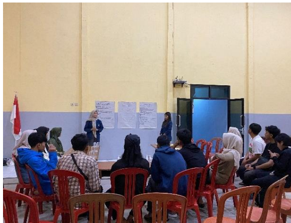
Foto 4.8 Pelaksanaan Kegiatan ToP

Rencana intervensi merupakan suatu tahapan dimana praktikan bersama dengan masyarakat desa puncak akan menyusun rancangan-rancangan kegiatan ataupun menentukan langkah yang akan dilakukan. Oleh karena itu, pada proses penyusunan rencana intervensi ini dilakukan dengan mengedepankan partisipasi pihak-pihak yang akan dilibatkan melalui kegiatan Community Meeting dengan menggunakan teknik Technology of Participation (ToP) . Pelaksanaan rencana intervensi dilakukan pada hari Rabu, 20 November 2024 pada pukul 18.30 WIB bertempat di Balai Desa Puncak. Pelaksanaan penyusunan rencana intervensi dilakukan dengan metode partisipasi dengan melibatkan interest group seperti