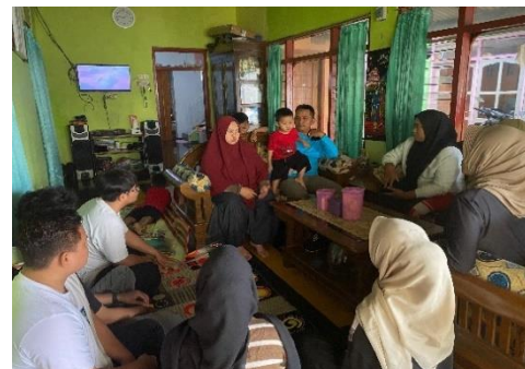
Foto 4.2 Kunjungan Kerumah Kadus Ciwuni I & Kepala Sekolah Paud

Pada tahapan ini praktikan bersama dengan kelompok melakukan home visit rumah mulai dari rumah Kepala Dusun, Tokoh Agama, Ketua RT, Ketua Bumdes, Kader PKK, Kader Posyandu dan interest group yang berpotensi dalam membantu jalannya pelaksanaan praktikum. Kegiatan home visit praktikan lakukan dengan tujuan untuk menjelaskan mengenai maksud dan tujuan praktikum sehingga mendapatkan dukungan atas rencana kegiatan yang akan dilakukan oleh praktikan dan dengan melakukan home visit praktikan dapat dikenal dan diterima dalam masyarakat. Melalui kegiatan home visit dengan melakukan diskusi informal praktikan dapat menggali informasi baik mengenai potensi dan sumber yang dimiliki, karakteristik masyarakat, budaya yang ada dimasyarakat, gambaran permasalahan yang ada di Desa Puncak serta batasan-batasan wilayah dari dusun ke dusun.