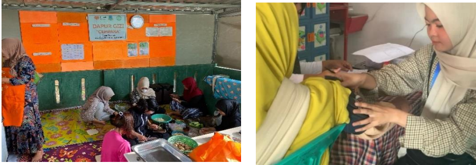
Foto 4.3 Kegiatan Community Involvement

Kegiatan community involvement dilakukan mulai sejak tanggal 01 November 2024 dengan melibatkan diri dan ikut berpartisipasi dalam kegiatan masyarakat Desa Puncak seperti kegiatan rapat koordinasi posyandu, kegiatan rutin posyandu, betani, pengolahan PMT dapur Gizi dan pembuatan produksi UMKM. Kegiatan ini diikuti oleh seluruh kader posyandu yang ada di Desa Puncak dimana sudah menjadi kegiatan rutin setiap bulan. Selain itu, praktikan juga melibatkan diri dalam kegiatan rutin posyandu yang dilakukan di setiap dusun yang dilaksanakan secara bergiliran pada setiap dusunnya, praktikan ikut berpartisipasi dalam berlangsungnya kegiatan posyandu tersebut seperti ikut membantu dalam pengecekan kesehatan yang dilakukan dalam kegiatan posyandu. Kegiatan selanjutnya praktikan juga ikut terlibat dalam proses pembuatan produksi beberapa UMKM yang ada di Desa Puncak, seperti pembuatan produksi cireng, cucur, dan kripik gemblong. Sehingga dengan mengikuti kegiatan ini praktikan mengenal dan memahami berbagai kegiatan yang dilakukan masyarakat Desa Puncak.