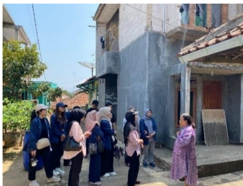
Foto 4.5 Kegiatan Transect Walk

Kegiatan asesmen awal ini dimulai dengan agenda pengenalan PPKS dan PSKS dengan sosialisasi jenis-jenis Penyandang Masalah Kesejahteraan Sosial (PMKS) dan Potensi Sumber Kesejahteraan Sosial (PSKS) menurut Permensos No.8 Tahun 2012. Kemudian praktikan meminta partisipan bersama-sama mengidentifikasi berbagai macam permasalahan yang muncul di Desa Puncak dan kemudian menuliskan permasalahan tersebut kedalam metacard yang telah disediakan dan meminta partisipasi menempelkannya pada kolom yang sudah disediakan. Setelah itu praktikan bersama dengan partisipan kembali mengidentifikasi permasalahan-permasalahan yang telah dituliskan dan kembali mengelompokkan permasalahan tersebut sesuai dengan kategorinya. Selain itu, proses asesmen juga dilakukan dengan menggunakan teknik Sustainability Livelihood Asset (SLA) untuk menganalisa masalah yang ada di Desa Puncak dan dikaitkan langsung dengan lingkup aset atau modal yang dapat dimanfaatkan oleh masyarakat secara keseluruhan. Melalui teknik ini praktikan mendorong partisipan untuk ikut mengidentifikasi sumber-sumber yang dapat dimanfaatkan dengan melakukan diskusi dan tanya jawab dengan partisipan.