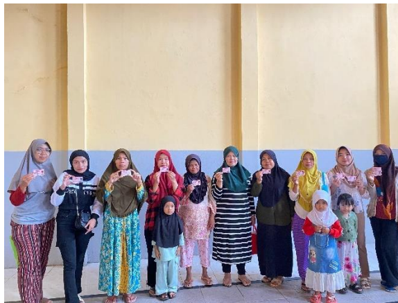
Foto 4.16 Hasil Kegiatan Pengabdian Kepada Masyarakat

kelahiran yaitu dengan perkiraan ada 10 lebih warga Desa Puncak melakukan perekaman dan perbaikan. berdasarkan capaian kegiatan ini terdapat ada 35 warga yang mendapatkan langsung KTP, termasuk di antaranya penyandang disabilitas, dan lansia. Selain itu diketahui terdapat ada 50 anak yang mendapatkan langsung Kartu Identitas Anak (KIA). Dan ada sekitar 20 orang lebih melakukan perbaikan kartu keluarga dan akta kelahiran untuk memperbarui dokumen mereka.