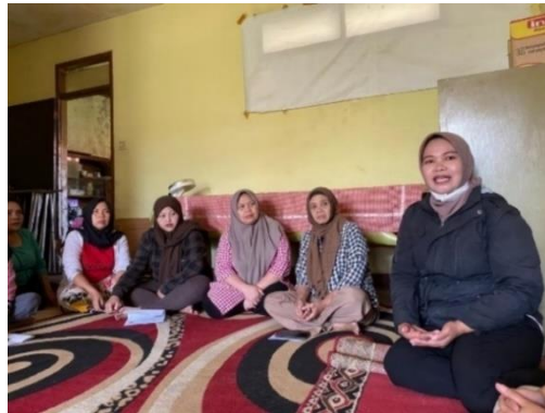
Foto 4.11 Pelaksanaan Kegiatan Tahap Evaluasi