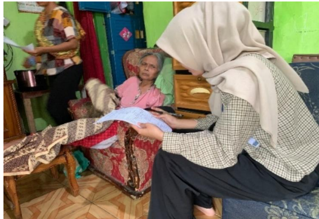
Foto 5.6 Keterlibatan Dalam Kegiatan Asesmen Bantuan Kementrian Sosial

Kegiatan ini merupakan proses identifikasi penerima manfaat program bantuan sosial di Desa Puncak. Praktikan bersama pendamping lapangan dan perangkat desa melakukan pendataan langsung ke rumah-rumah warga yang menjadi calon penerima bantuan. Dalam asesmen ini, dilakukan wawancara untuk mengumpulkan informasi mengenai kondisi ekonomi, kesehatan, dan kebutuhan mendesak dari setiap keluarga. Praktikan membantu dalam pencatatan data, pelaksanaan survei lapangan, serta pendampingan dalam proses verifikasi dokumen. Kegiatan ini bertujuan untuk memastikan bahwa bantuan sosial tepat sasaran dan memberikan manfaat bagi masyarakat yang membutuhkan.