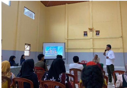
Foto 4.9 Pelaksanaan Kegiatan Intervensi Penyuluhan UMKM

Penyuluhan dilaksanakan pada hari Sabtu, 23 November 2024 bertempat di Gedung Balai Desa Puncak pada pukul 15.00 WIB. Praktikan dan TKM mengundang target group yaitu pelaku UMKM di Desa Puncak dan beberapa pihak seperti Ketua Badan Permusyawaratan Desa dan Kepala desa, beserta perangkatnya. Pelaksanaan penyuluhan pemasaran digital yang bertujuan untuk memberikan edukasi, meningkatkan pemahaman dan pengetahuan kepada para pelaku UMKM mengenai pemasaran digital guna menciptakan UMKM yang maju, berkembang, dan berdaya.