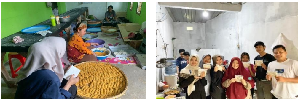
Foto 4.7 Kunjungan Tempat Produksi UMKM

mengaku bahwa mereka ingin memajukan usaha mereka dan ingin belajar mengenai pemasaran digital secara luas dan bisa mengikuti perkembangan zaman yang serba digital namun desa belum pernah melakukan sosialisasi ataupun pelatihan terhadap pelaku UMKM sehingga pengetahuan mereka mengenai pemasaran digital juga masih sangat terbatas dan pemasaran yang mereka lakukan belum optimal. Selain itu, praktikan juga melakukan wawancara dengan interest group yaitu dengan ketua BUMDes, Karang Taruna, Kader PKK, dan beberapa Kepala Dusun. Berdasarkan wawancara yang dilakukan diketahui permasalahan lain yang dialami oleh pelaku UMKM yakni mengenai koordinasi antara pemerintah desa dan pelaku UMKM tidak berjalan baik sehingga UMKM kurang dibina dan didampingi sehingga belum adanya upaya penanganan dari pemerintah ataupun pengajuan dari pelaku UMKM.