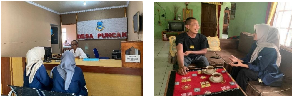
Foto 4.6 Kegiatan Studi Dokumentasi Bersama Sekertaris & Ketua BUMDes

Asesmen lanjutan adalah kegiatan yang dilakukan praktikan untuk menggali isu masalah secara khusus dan mendalam. Pada hal ini praktikan melaksanakan diskusi bersama beberapa perangkat desa dan pendamping lapangan mengenai permasalahan yang praktikan ambil yaitu mengenai permasalahan yang sangat mempengaruhi ekonomi masyarakat desa yakni UMKM Desa Puncak yang belum berkembang dalam melakukan pemasaran produk. Kegiatan asesmen lanjutan dilaksanakan oleh praktikan sejak tanggal 11 November 2024 baik dengan melakukan studi dokumentasi ataupun secara home visit . Kegiatan penggalian data melalui studi dokumentasi praktikan lakukan dengan menemui sekretaris desa untuk melengkapi data ataupun yang perlu dikonfirmasi. Berdasarkan kegiatan studi dokumentasi praktikan lakukan diketahui bahwa pelaku UMKM desa belum terdata dan tertulis secara resmi oleh pihak desa, sehingga praktikan perlu melakukan pengumpulan data secara home visit dari kerumah rumah pelaku usaha UMKM. Kunjungan ataupun home visit baik kepada UMKM dilakukan dengan mengunjungi beberapa unit produksi milik UMKM yang cukup berkembang di Desa Puncak. Dalam kunjungan tersebut praktikan tidak hanya mendata pelaku UMKM namun praktikan juga melakukan observasi mengenai produksi dari awal pembuatan hingga siap saji.