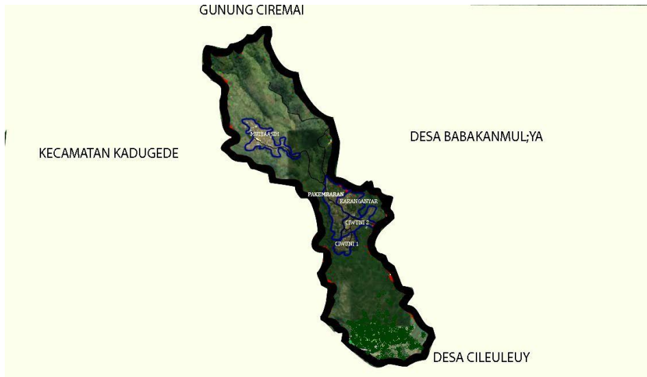
Gambar 3.1 Peta Desa Puncak

Desa puncak yang terletak di lereng Gunung Ciremai ini berbatasan dengan sebelah Barat gunung ceremai, sebelah Utara dengan Desa Pajambon, sebelah Selatan dengan kecamatan Kadugede yaitu Desa Bayuning, Ciherang dan Sagarahiang yang diawali dari Purna Jiwa dan batas alamnya adalah kali yang membentang sampai ke Kadugede, sebelah Timur dengan Desa Cileuleuy. Wilayah desa puncak dibagi menjadi beberapa kampung yaitu dusun Ciwuni 1, Ciwuni 2, Pakembaran, Mulya asih 1, Mulya asih 2, Karanganyar. Kemudian, kampung-kampung tersebut terdiri dari beberapa RT, yang diantaranya dusun Ciwuni 1 terdiri dari Rt.02 sampai Rt.05, dusun Ciwuni 2 terdiri dari Rt.06 sampai Rt.08, dusun Karanganyar terdiri dari Rt.09 sampai Rt.12, dusun Pakembaran Rt.13 sampai Rt.17, dusun Mulyaasih terdiri dari Rt.18 sampai Rt.24. Pada tahun 1980-an Desa Puncak dimekarkan menjadi dua desa, yaitu Desa Puncak dan Desa Cisantana, kemudian batas desa pun berubah menjadi sebelah Barat Gunung Ceremai, sebelah Utara Desa Cisantana. Setelah itu, sekitar tahun 1983-an dimekarkan lagi menjadi tiga desa, yaitu Desa Puncak, Desa Cisantana dan Desa Babakanmulya, oleh sebab itu batas desa sebelah Timur pun menjadi berubah dari Desa Cileuleuy menjadi Desa Babakanmulya. (Sumber: Hasil studi dokumentasi praktikan)