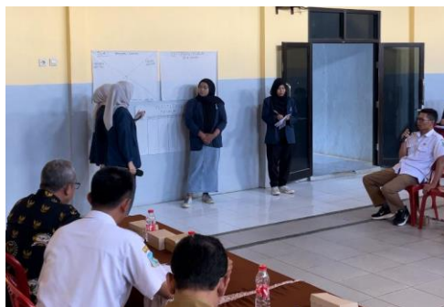
Foto 4.4 Kegiatan Tahapan Asesmen

Pelaksanaan rembug warga dilaksanakan pada hari Selasa, tanggal 05 November 2024 di Balai Desa Puncak pukul 09.00 WIB. Kegiatan asesmen awal dilakukan dengan tujuan untuk menggali permasalahan ataupun potensi sumber yang ada di Desa Puncak. Penggalan masalah atau asesmen awal ini tentu saja melibatkan anggota masyarakat Desa Puncak yang lebih mengetahui kondisi permasalahan yang ada di Desa Puncak. Pada kegiatan rembug warga ini praktikan melakukan asesmen awal mengenai permasalahan yang ada di Desa Puncak dengan menggunakan teknik Metode Partisipatory Assesment (MPA) dan melakukan penggalan aset atau modal dengan teknik Sustainability Livelihood Asset (SLA) . Kegiatan ini menekankan pada keterlibatan partisipasi masyarakat