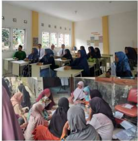
Implementasi model capacity building dan motivasi collaborative learning bagi pelaku UMKM di desa mekarmukti kecamatan cihampelas kabupaten Bandung barat